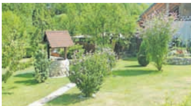
Najlepši cvetlični vrt je uredil Srečko Zurc.