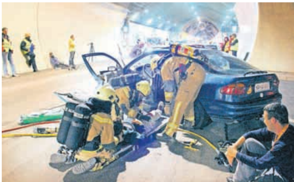
Vozila so bila polna ponesrečencev s hudimi in lažjimi poškodbami, ki so jih morali s hidravličnim razpiralom in škarjami rešiti iz vozil.