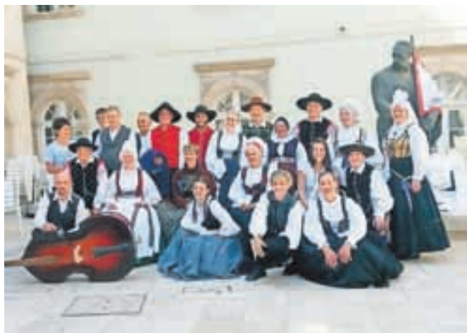
Na koncertih skupin, ki imajo v imenu Triglav, sodelujejo tudi folkloristi FS Triglav Slovenski Javornik.