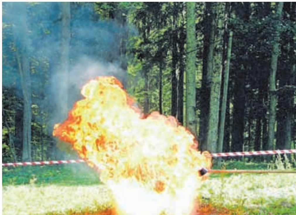
Posledica nepravilnega gašenja posode z oljem z vodo – maščobna eksplozija (liter vode v dva litra vročega olja)

– Če smo ostali v stanovanju in bi bila evakuacija prenevarna (zadimljeni hodnik, previsoka temperatura), zapremo vsa vrata, tla pred vrati ter dele, kjer vdira dim v prostor, pa založimo z mokrimi brisačami, krpami. Dihanje v zadimljenem prostoru si lahko delno olajšamo tako, da si usta ter nos