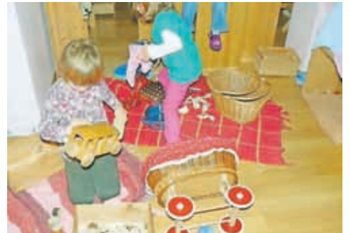
Vrtec ta čas obiskuje sedem otrok, starih od enega do petih let.