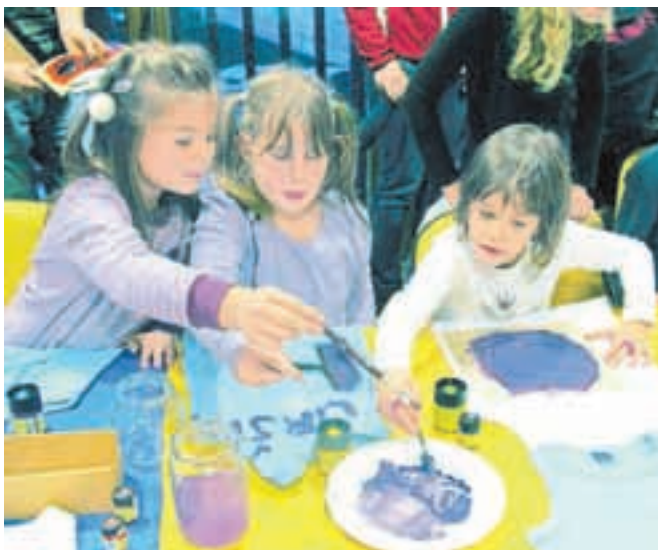
Izdelovali so košarkarske drese.