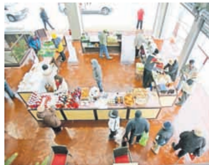
Tržnica kljub umiku koncesionarja ostaja odprta, za nemoteno obratovanje bo poskrbela Občina Jesenice.

A-kont je Občini Jesenice podal predlog za sporazumno prekinitve koncesijske pogodbe. Občina bo iskala novega koncesionarja, tržnica pa ostaja odprta.