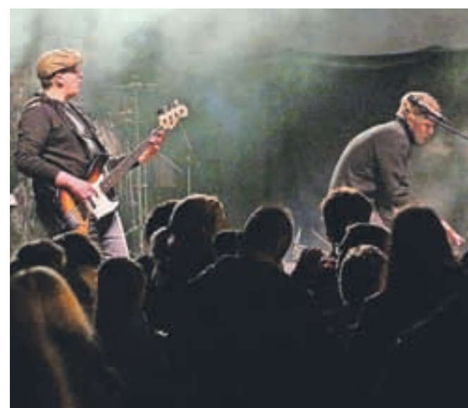
Nastopili so tudi Witchass.