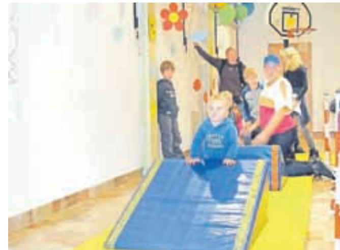
Za najmlajše so pripravili športni poligon, na katerem so lahko preskusili svoje spretnosti.