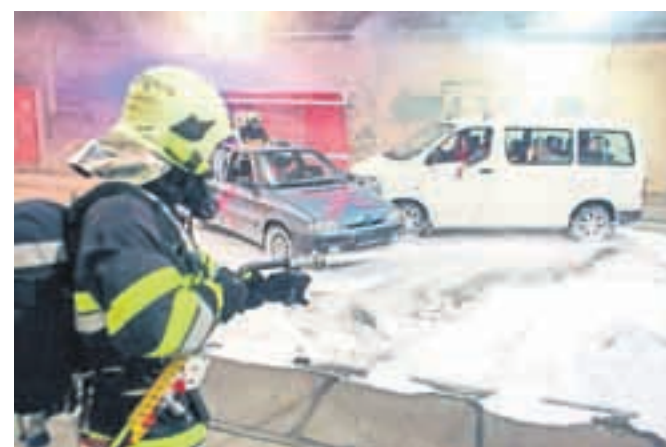
Prvi del vaje, kjer so se s trčenjem osebnega avtomobila in manjšega avtobusa, ki je tudi zagorel, spopadli avstrijski gasilci.