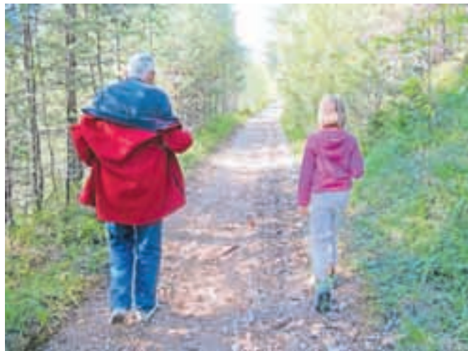
Pot vodi od opučenih teniških igrišč na Kresu do Doma Pristava v Javorniškem Rovtu, dolga je okrog štiri kilometre in je označena kot lahka, nezahtevna pot.