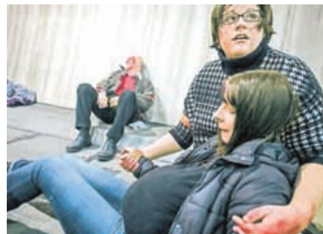
Med poškodovanimi so bili tudi posebni primeri – nosečnice, otroci, nepoškodovani a nezavestni, ki so od reševalcev terjali posebno obravnavo.