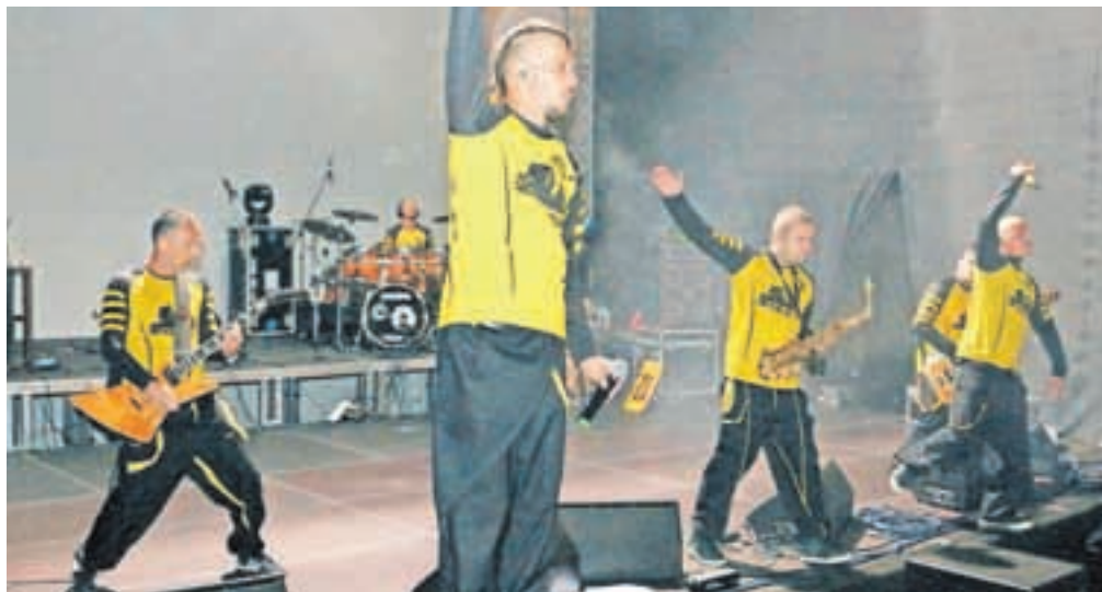
Vrhunec večera pred polno halo na Stari Savi: priljubljena bosanska zasedba Dubioza Kolektiv