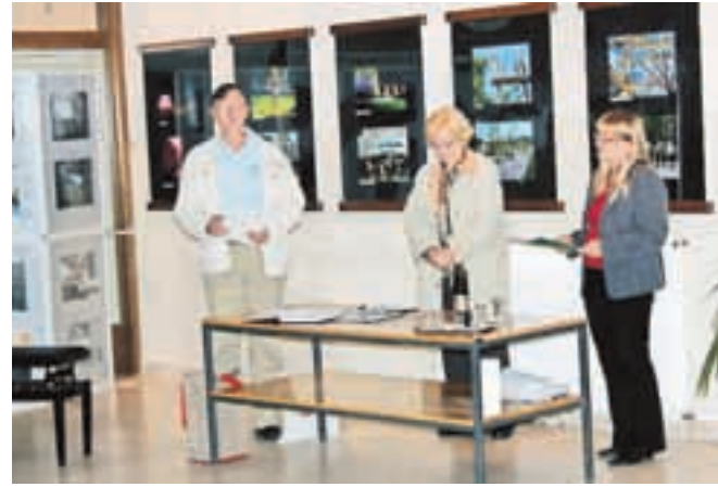
V galeriji fotografskega društva Jesenice v avli gledališča Toneta Čufarja so odprli razstavo fotografij članov pobratene fotografskega društva iz Nagolda.