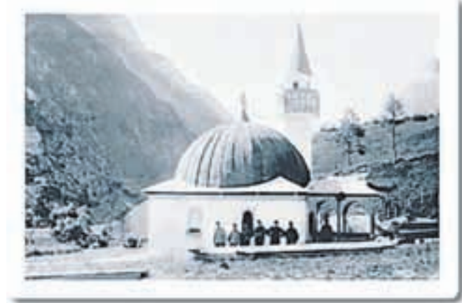
Mošeja v Logu pod Mangartom