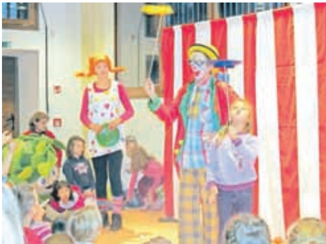
Klovn Jaka in Pika Nogavička sta otroke učila vrtenja krožnikov na palici.

ma Igra in dediščina v enkoš spoznavali zgodovino košarke na Jesenicah, se pomerili v kvizu, ustvarili kolaž letošnje maskote Eurobasketa 2013 Lipka, otroci pa so si lahko izdelali tudi košarkarske drese.