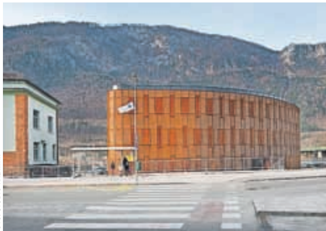
Upravni center Jesenice je primer dobre arhitekture.