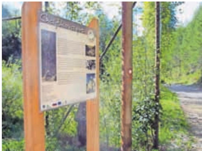
Občina Jesenice je ob poti postavila tri informativne table, s katerih pohodniki lahko dobijo informacije o sami poti in o lokalnem okolju, postavili so štiri lesene klopi in pitnik za vodo.