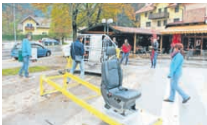
Na preventivni akciji so obiskovalci lahko preizkusili zaletavčka in obračalnik.