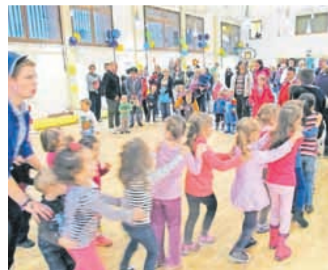
Zapeli in zaplesali so pod vodstvom mladih animatorjev.