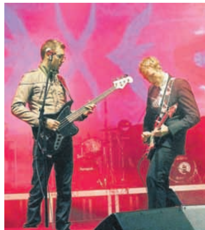
S tršimi ritmi so publiko razgrela alter rockerji Supersunset.

Poseben dobrodelni dogodek pa so organizatorji pripravili ob festivalu, saj so izkupiček od prodaje kolačkov – muffinov v celoti namenili Zvezi društev prijateljev mladine za letovanje otrok v letovišču Pinea. Kolikšen je bil izkupiček, pa zaenkrat še ni znano.